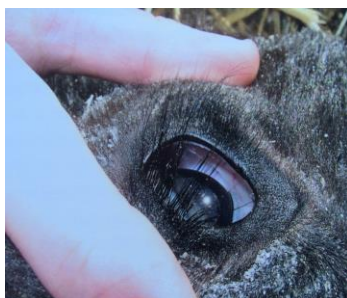
Figura 2: Vitelo com olho côncavo, consequente da desidratação.