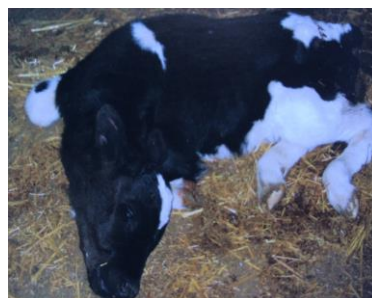
Figura 3: Vitelo com falta de vitalidade e incapacidade de manter-se de pé.

Muitas vezes, estão implicados vários agentes e fatores, tornando-se difícil precisar com exatidão a causa da diarreia.