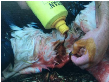
Figura 5: Desinfecção do umbigo com solução iodada.

Um parto difícil, diminui a vitalidade do vitelo, dificulta a ingestão de quantidades razoáveis