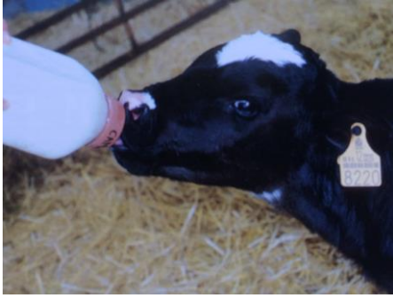
Figura 4: Alimentação manual de um vitelo com o uso de uma tetina.

Devemos começar a preservar a saúde do vitelo já na própria vaca prenha e inclusive antes da própria cobertura. Tudo o que ocorre na vaca irá ter precursões no vitelo. Nesta fase, deve-se ter em conta as infecções com transmissão de mãe para filho, como é o caso da tuberculose, brucelose, BVD, leptospirose, salmonelose, etc., que originam vitelos mais sensíveis e com maior risco de contrair infecções. A vacinação contra determinadas afeções reduz significativamente o risco de transmissão, como é o caso do BVD.