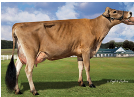
M: River Valley Nitro Brazil 930