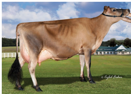
GM: Gabys Vibrant Brazil